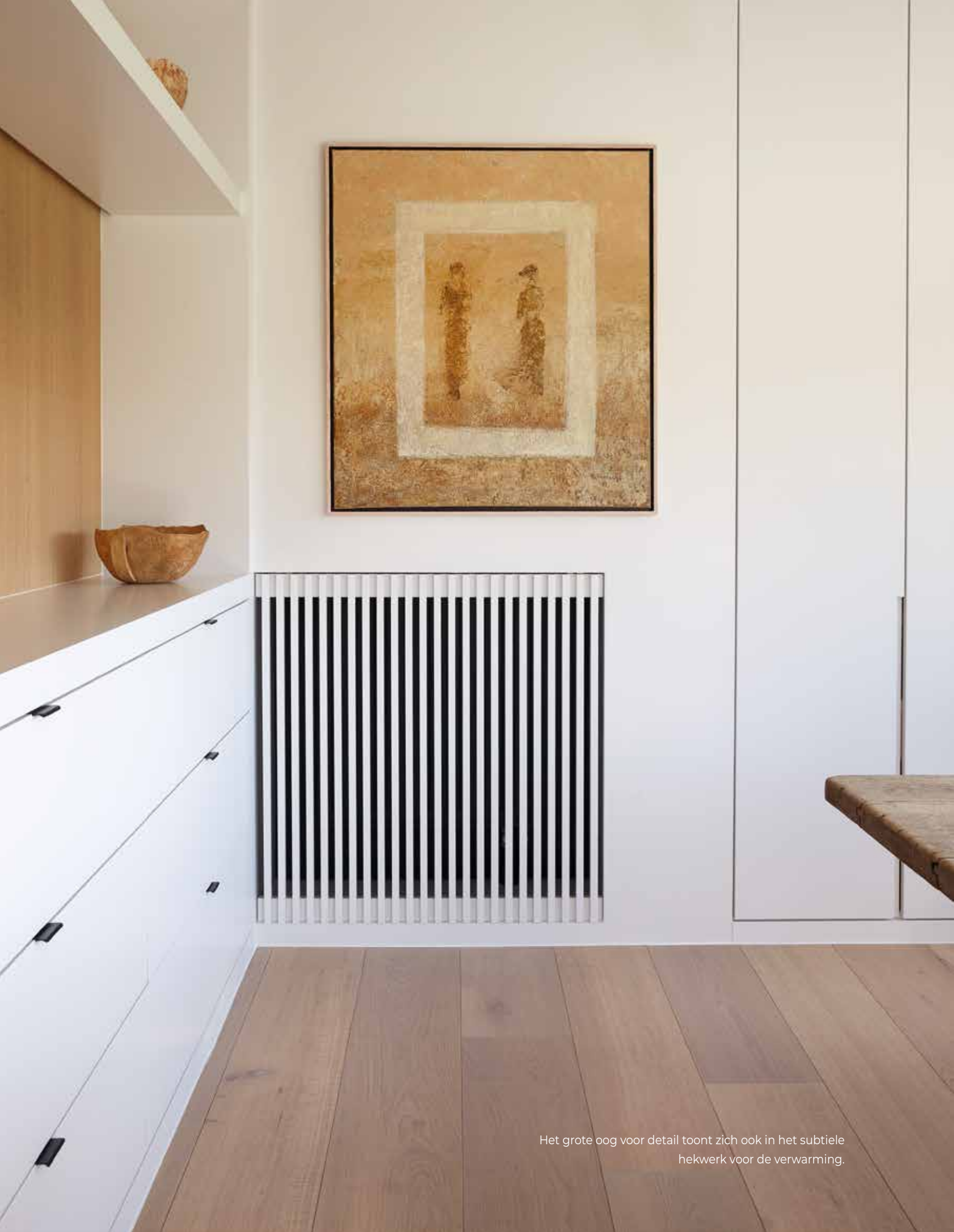
Het grote oog voor detail toont zich ook in het subtiel hekwerk voor de verwarming.