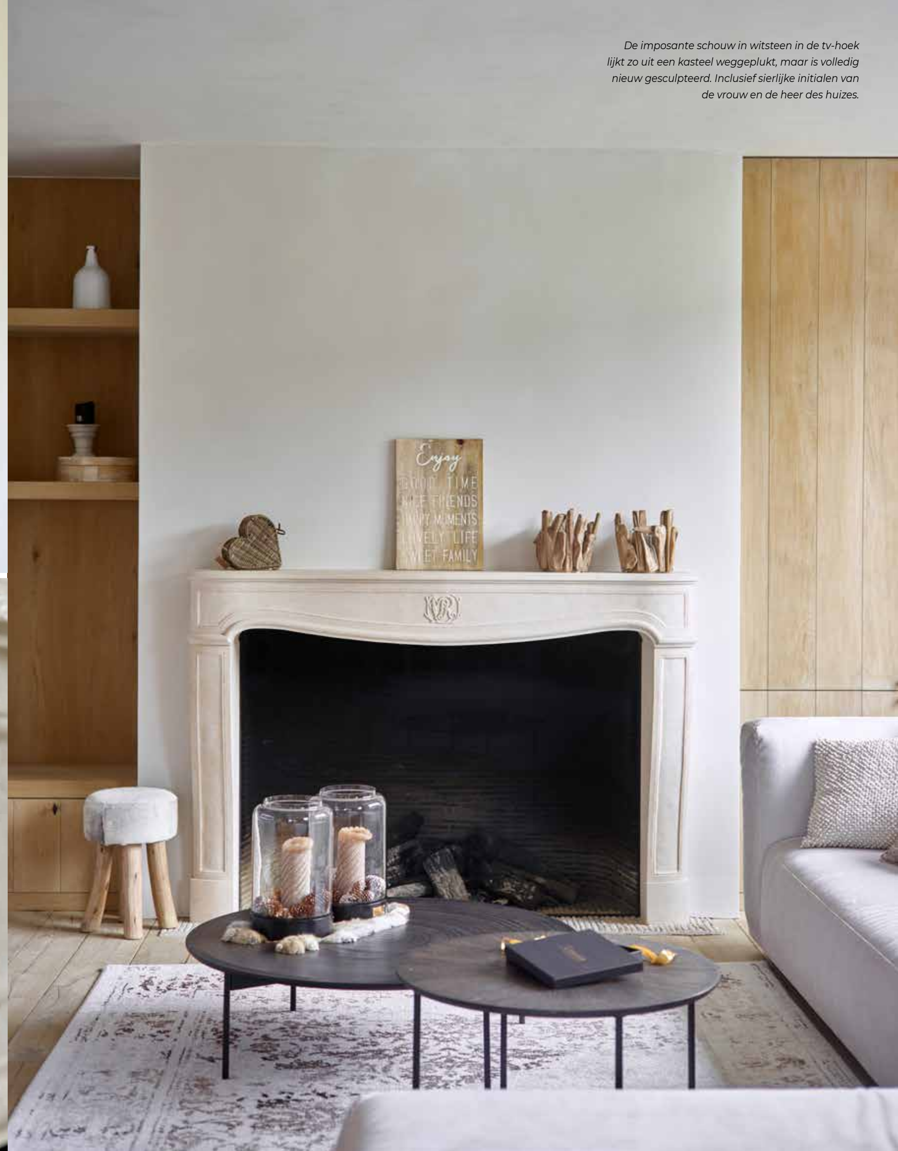
De imposante schouw in witsteen in de tv-hoek lijkt zo uit een kasteel weggeplukt, maar is volledig nieuw gesculpteerd. Inclusief sierlijke initialen van de vrouw en de heer des huizes.