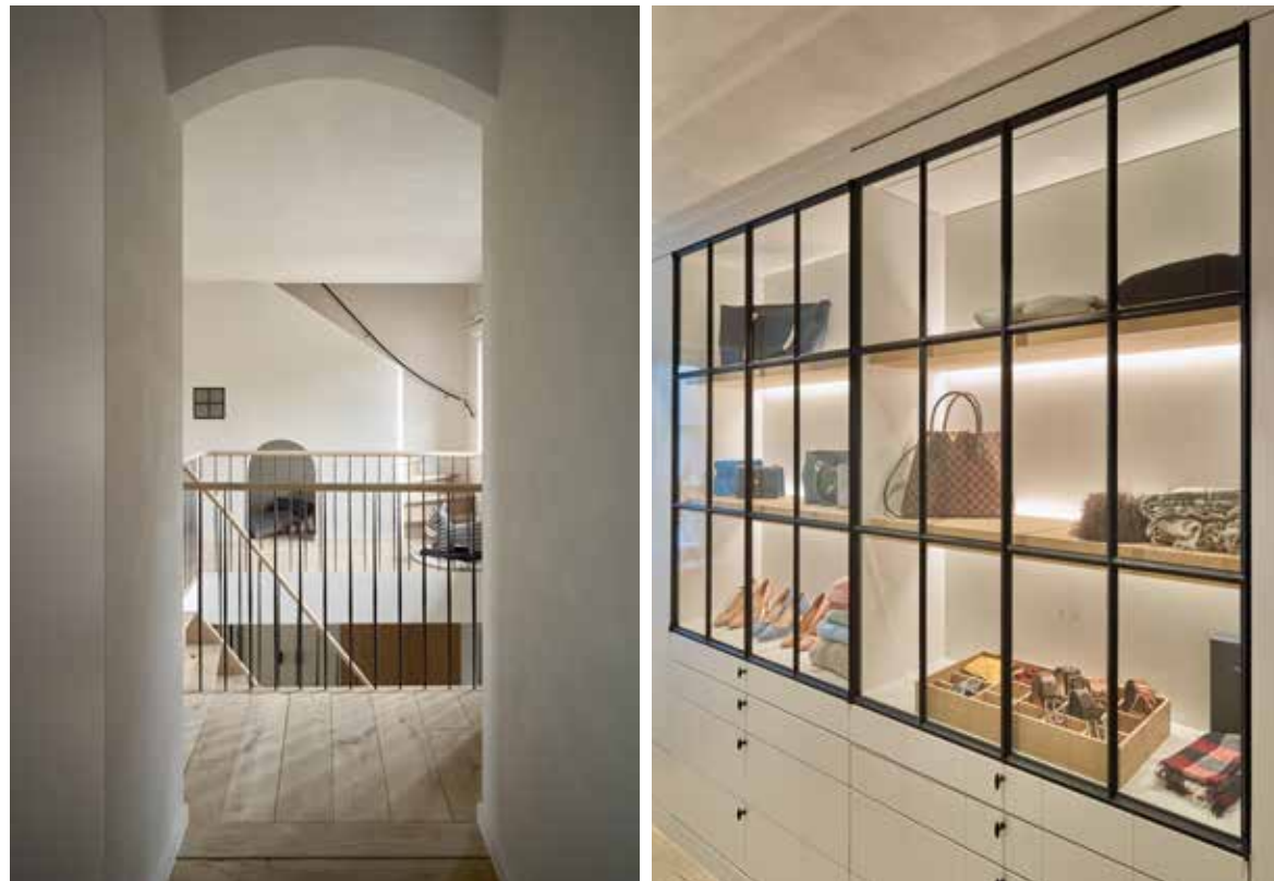
De dressing is opgevat als een luxeboetiek, met een heuse etalage voor favoriete stuks en chique accessoires.